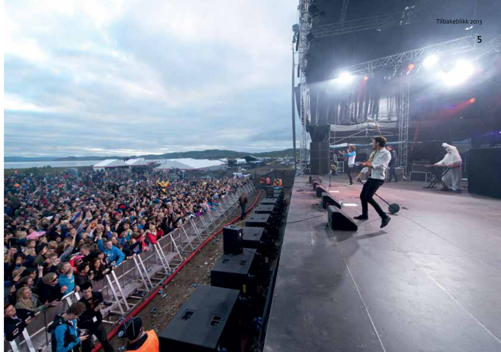
MIDNATT I PORSANGER. Det ser lyst ut både for festivalpublikum og næringslivet i Porsanger.