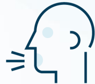
VOICE USER INTERFACE